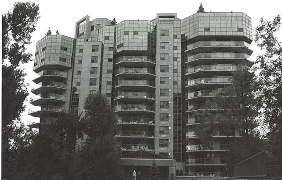
par Bernard Paré

Entourées d'un parc planté d'arbres centenaires, à quelques mètres du majestueux Saint-Laurent, se dressent à Saint-Lambert trois tours élégantes aux reflets bleutés offrant une vue imprenable sur le centre-ville de Montréal et l'île Notre-Dame. Construit à la fin des années 80 par